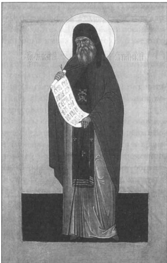
Икона преподобного Макария Оптинского Конец XX века

Достопочтеннейшая о Господе N.N.!* За посещение Ваше и супруга Вашего N.N. нашей обители усердно Вас благодарим. Благочестивое Ваше расположение к нашей обители остается памятником** для нас; а по возвращении Вашем в П. Вы посетили худость мою почтенным Вашим писанием, от 7 августа посланным.