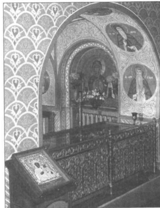
Рака с мощами преподобного Макария в храме Владимирской иконы Божией Матери

Жертвенное служение старца было увенчано его блаженной кончиной, последовавшей 7 сентября 1860 года. Он был похоронен вблизи Никольского придела Введенского собора. В 2000 году преподобный оптинский старец Макарий был прославлен в лике святых Архиерейским Собором Русской Православной Церкви. Святые мощи были обретены и ныне покоятся в раке рядом с мощами преподобного Льва.