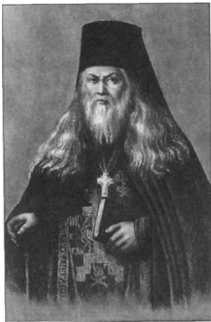
Преподобный Лев Оптинский Литография XIX века

Макария эти труды были бесценным руководством в стяжании внутренних добродетелей. Он внимательно изучал святоотеческие творения, а также переписывал их уставом, которым овладел специально для этого. Сделанные им точные списки с переводов преподобного Паисия впоследствии послужили основой для книгоиздательской деятельности Оптиной пустыни, а усвоенное святоотеческое учение помогло старцу Макарию в последующем окормлении многочисленных духовных чад.