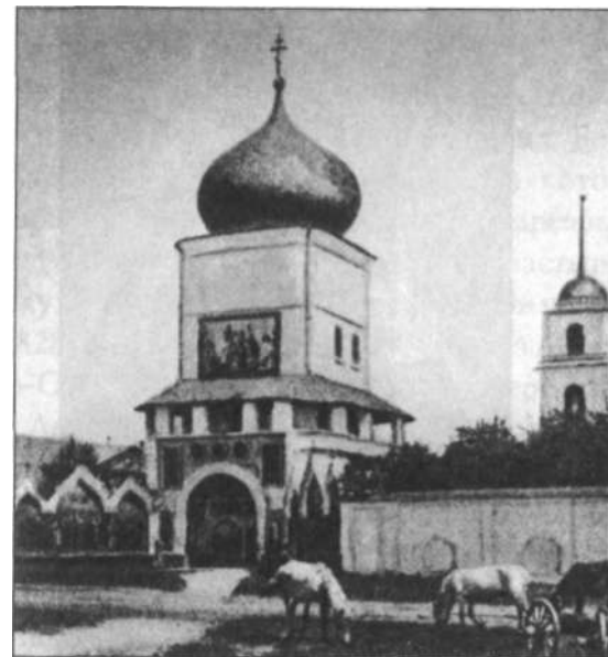
Богородицкая Площанская пустынь