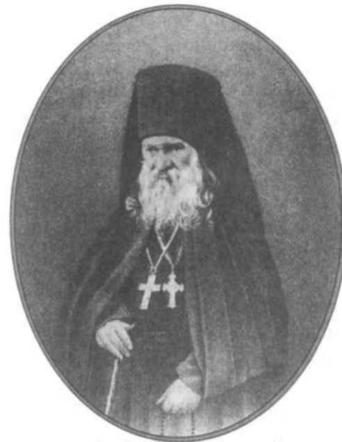
Преподобный Макарий Оптинский Литография. 1860-е годы